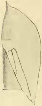
Fig. 1. Cuneus und Membran.

exeunte, margine apicali membranae intra dentem sinuato (vide fig. 1). Alae apicem abdominis longe superantes, hemelytris paullo breviores, margine exteriori subrectae, apice anguste rotundatae, margine interiori late fortius rotundatae, parte inter cellulam et apicem sita maxima parte ultra abdomen extensa. Pedes graciliusculi,